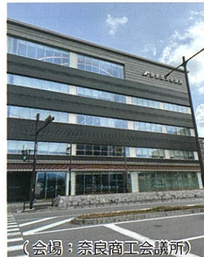
（会場：奈良商工会議所）