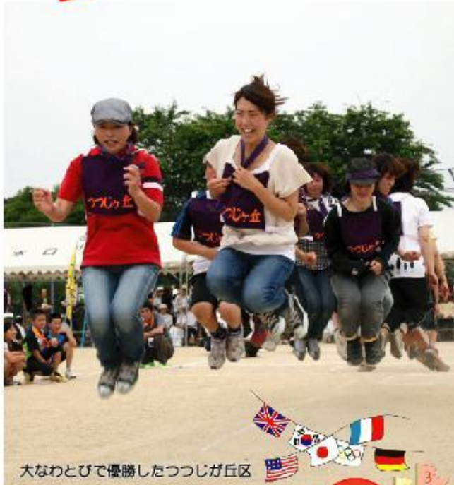
大なわとびで優勝したつつじが丘区