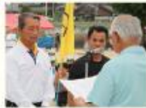
(総合優勝の今郷区)