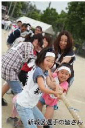
新城区選手の皆さん