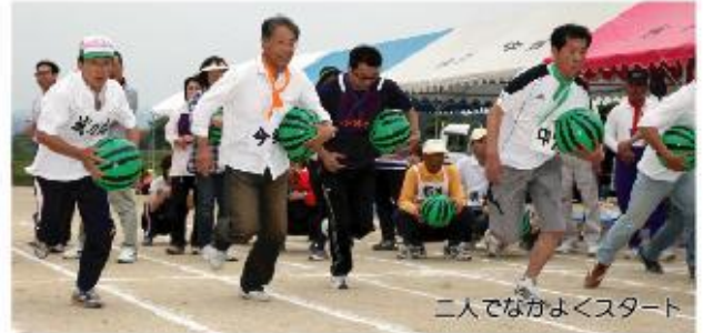
二人でながよくスタート

岩上自治振興会主催としては2回目となる「ふれあい運動会」が6月9日開催されました。今年は空梅雨模様で雨の心配なく、全てのプログラムがほぼ予定通り午前中で終了。7つの地区が6つの得点競技を競い、優勝は全ての種目で平均して高得点を記録した今郷区、準優勝は中畑区、三位は巖峨区がそれぞれ成績を修められました。