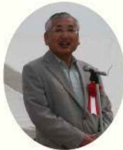
御来賓代表 中嶋市長挨拶