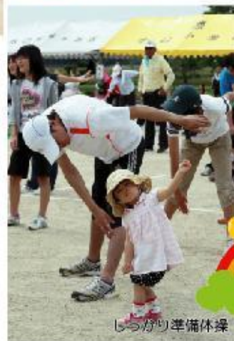
じつがり準備体操