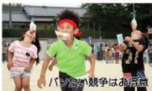
バナナ食い競争はお得意

来年は1つの区切りとなる30回目の記念開催となります。継続することの意義や価値が見直される今日。自治振興会では、人がふれあうことによって生まれる連帯感や絆が、地域のあらゆる場面でプラス効果として作用し、さらなる発展へと繋がるように工夫や改善をしていきたいと考えます。より多くの方のご理解とご協力をお願いいたします。