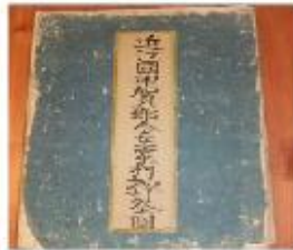
須恵器古窯跡の再発見