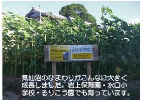
気仙沼のひまわりがこんなに大きく成長しました。岩上保育園・水口小学校・るりこ園でも育っています。

平成23年に甲賀市市民協働事業提案制度が創設されたので、今郷歴史街道整備事業として提案し書類選考と公開プレゼンテーション審査を経て採択された。この事業は歴史文化財課と協働しており約2年を経過した。