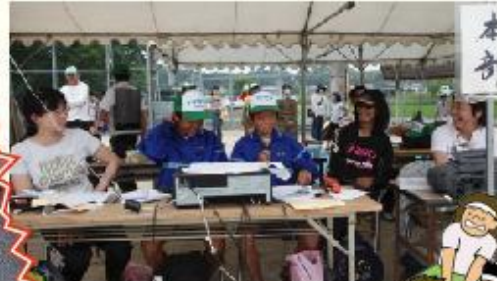
本部進行係でアナウンス