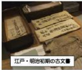
江戸・明治初期の古文書