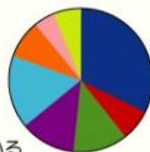
【ボランティアに参加していない理由】