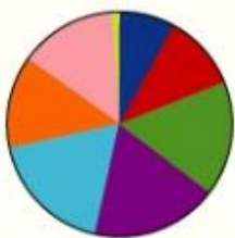
【ボランティアに参加している理由】

また、「ボランティア活動充実のための基盤整備や活動」については、「広報・啓発の充実」「専門性のある職員やアドバイザーの配置」「相談窓口の充実」が多くありました。